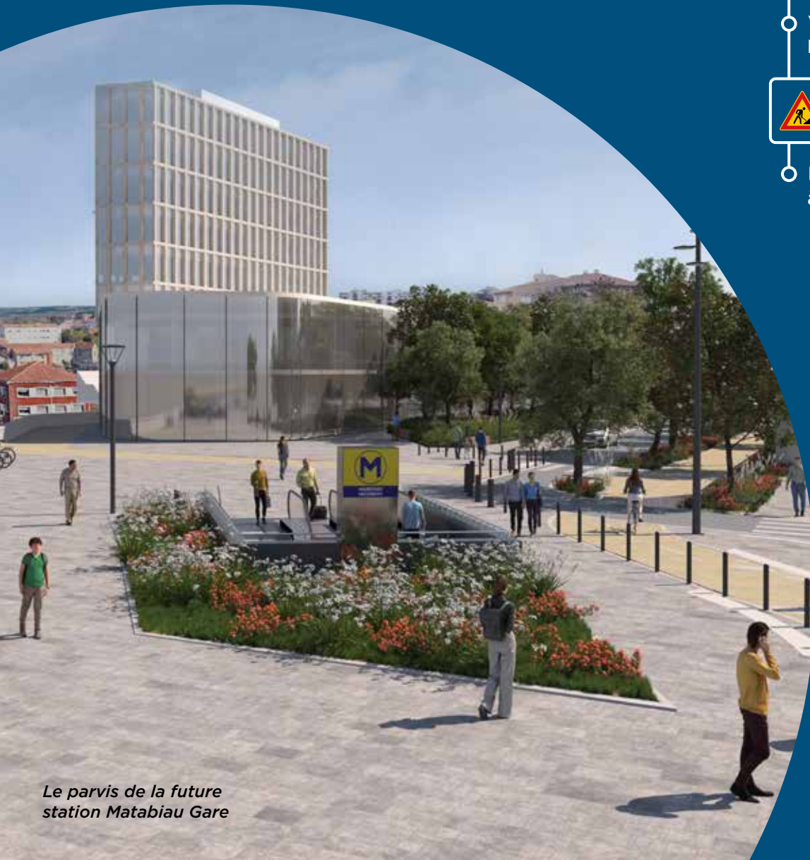
Le parvis de la future station Matabiau Gare