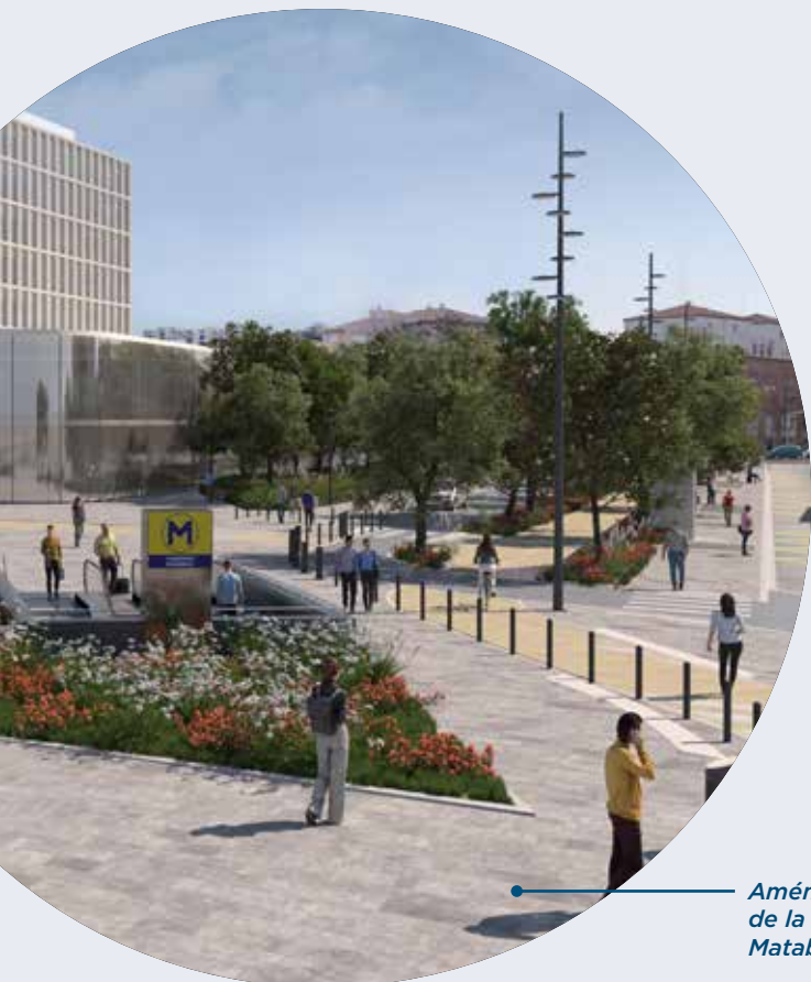
Aménagement de la station Matabiau Gare

En 2028, à la mise en service de la ligne C, le réseau de transport en commun desservira directement 500 000 habitants, 60% des habitants de la grande agglomération toulousaine seront à moins de 10 minutes des stations et des arrêts.